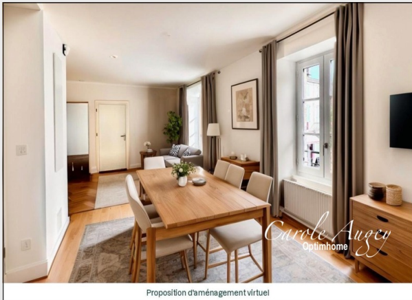
Proposition d'aménagement virtuel